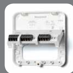
Placa de montaje del receptor